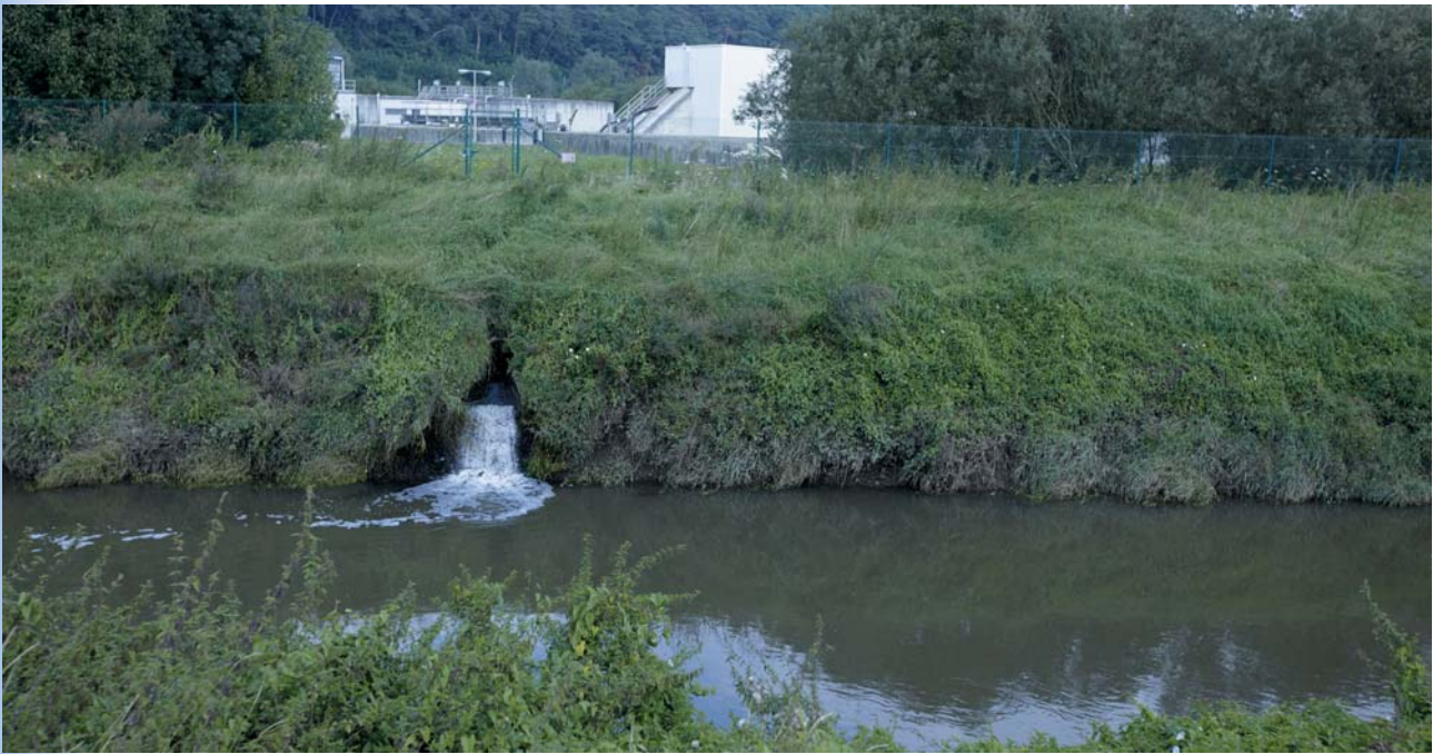
VDB + Aquafin NV