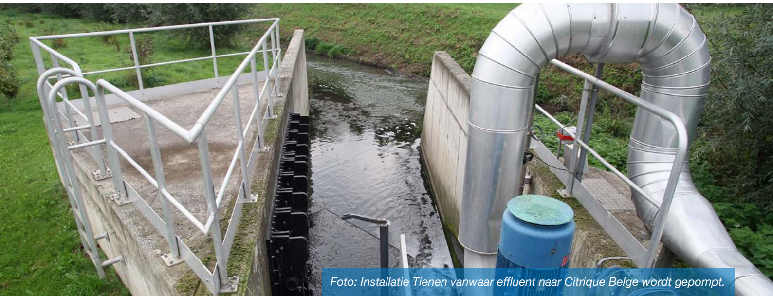
Foto: Installatie Tienen vanwaar effluent naar Citrique Belge wordt gepompt.